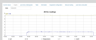
Historique des données